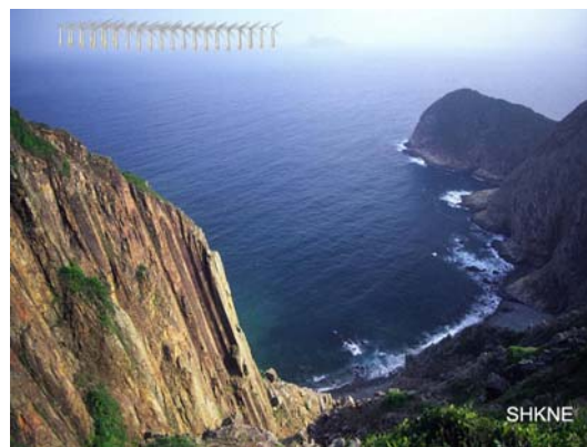
建立風電場後的模擬景觀