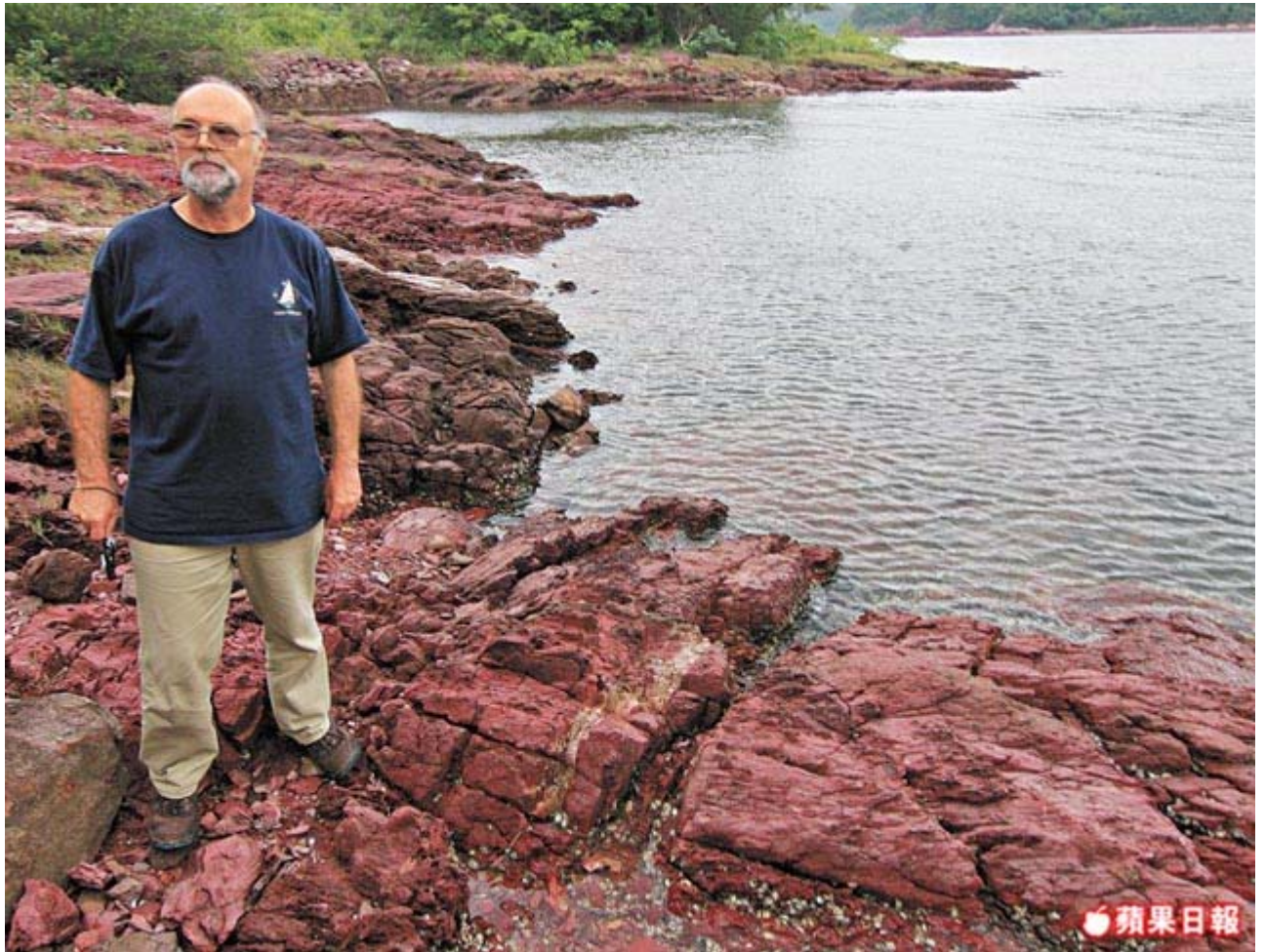
Newsome 認為香港絕對有資格成為世界級地質公園，可惜大部份港人卻不識寶。