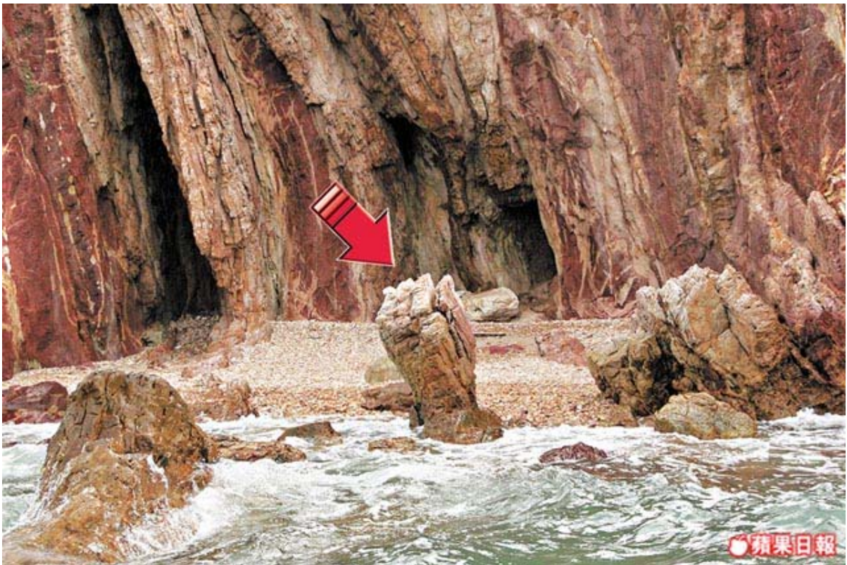
黃竹角嘴的岩石，已有 4 億年歷史，包括被形容為「鬼手」的岩石（箭嘴示）。