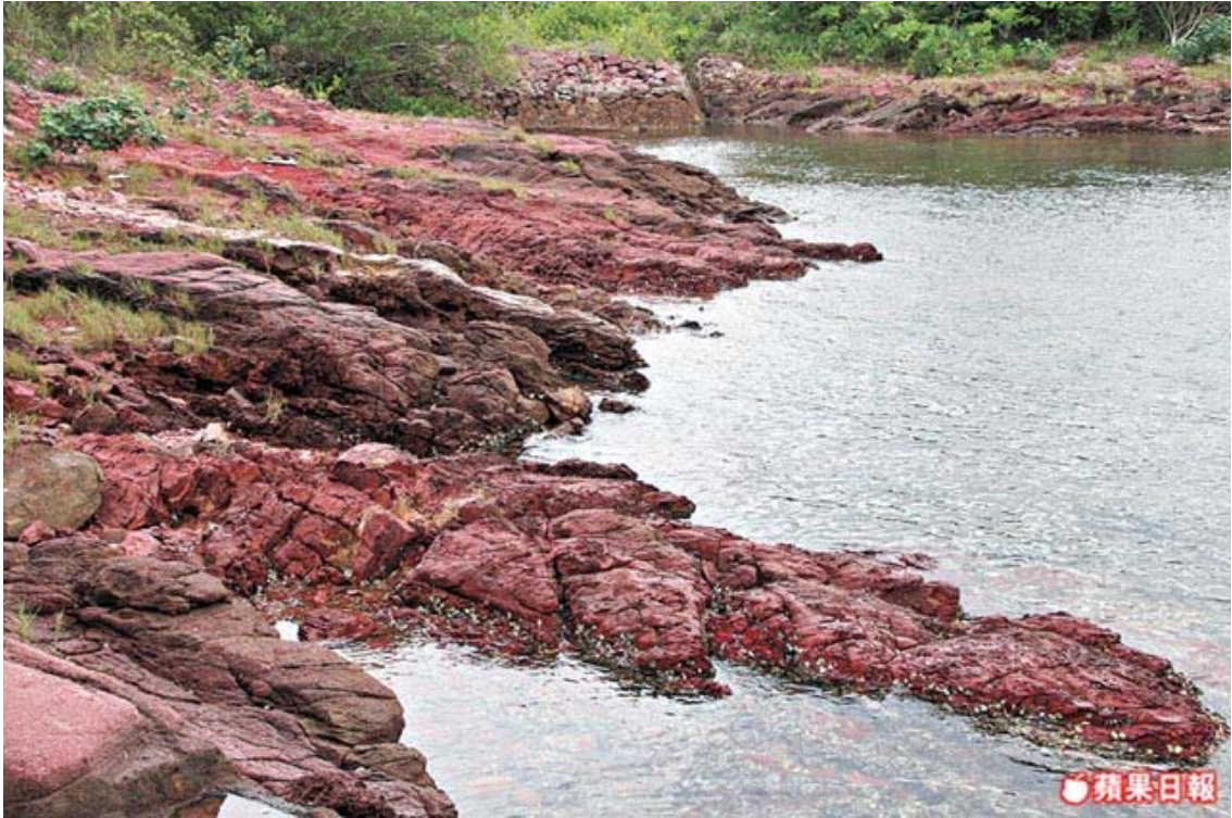
印洲塘紅石門的礫岩，色紅如火。