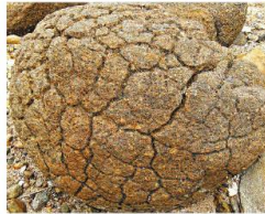
▲西貢橋嘴島沙堤上有一塊大石，它猶如一個美味的菠蘿包。